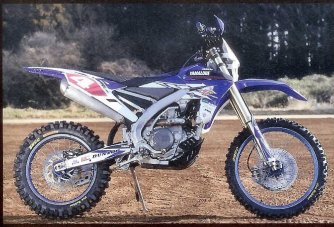
テスト使用タイヤ

VRM-300 GNCC Tackee / VRM-140 GNCC Tackee