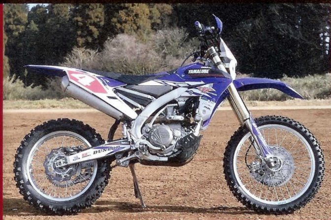
テスト使用タイヤ

タイ産の良質な天然ゴムを使用して、日本国内で製造されているこだわりのタイヤブランド・ビーラバー。VRM-300/VRM-140は難所も得意とする。「コンパウンドが柔らかいだけあって、スベル岩盤や木の根でもしっかりグリップしてくれます。そうするとGEKOTAに近いように思えますが、こちらのほうが使える路面は広いですね。ガレ場だけならGEKOTAに軍配が上がりますが、さまざまなフィールドを走るエンデューロレースを考えたら、使用路面のひろいVRM-300/VRM-140がおすすめです。JNCC、WEXの難所コースでおなじみの鈴ヶ岳、鈴蘭、栗子国際が適しています」